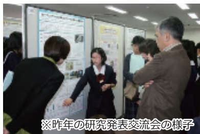
※昨年の研究発表交流会の様子